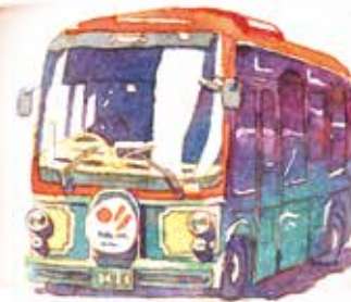
めぐりんバス停 東西めぐりん「西浅草三丁目」