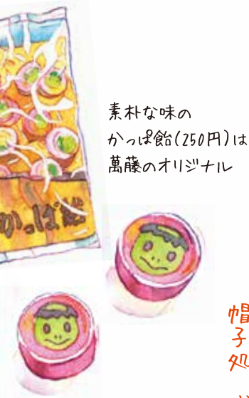
素朴な味の かつぱ飴(250円)は 萬藤のオリジナル