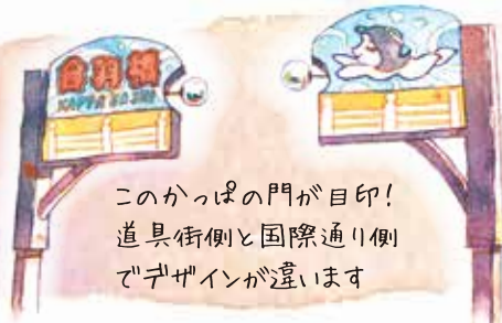
このかつぱの門が目印! 道具街側と国際通り側 でデザインが違います