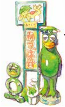
僕たちを 見つけて!