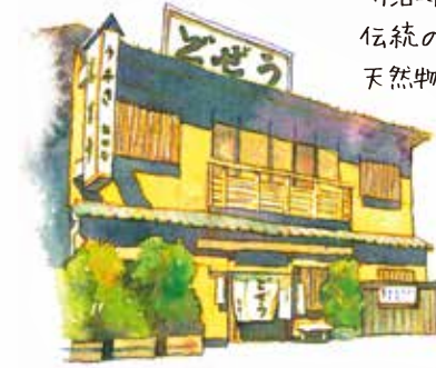
明治時代から続く老舗の 伝統の味を守るため、今も 天然物を厳選しているそうです